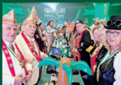
An den Tischen in der Volkswagen Halle herrschte stets gute Stimmung.