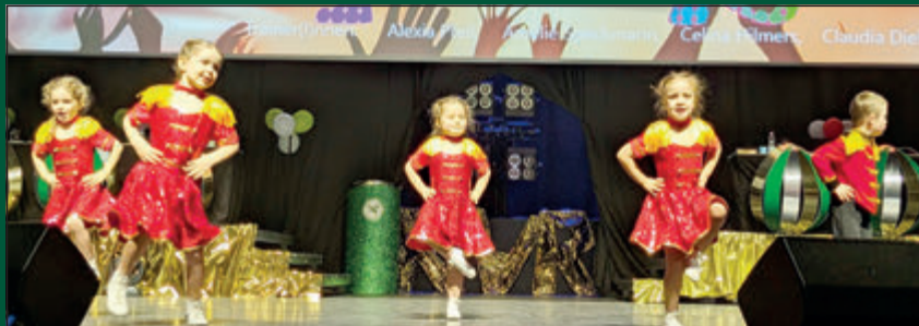
Zu Beginn hatten auch die Kleinsten der KTG, die Purzelgarde, ihren tollen Auftritt.

Auch tänzerisch und akrobatisch zeigte die Sitzung die ganze Vielfalt des Karne-