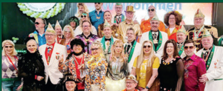
Diese Karnevalisten freuten sich auf den Abend in der Volkswagen Halle.