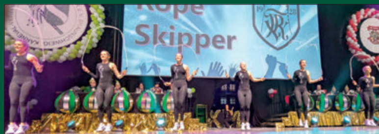
Es war ein sehr schwingvoller Auftritt, den die „Rope Skipper“ am Samstagabend den Karnevalisten präsentierten.