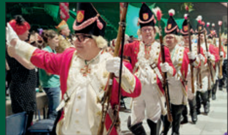
Der Ernennung der neuen Ehrenfunken ging der Einmarsch der Funkengarde voraus.