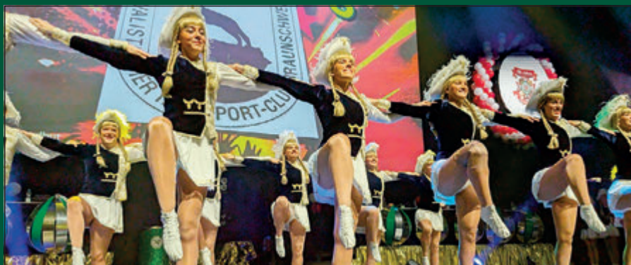
Die Große Prunksitzung der KVR am Abend vor dem Schoduveel hat begonnen. Vor 1.200 Besuchern tanzte die Karnevalistische Tanzsportgemeinschaft BS (KTG).