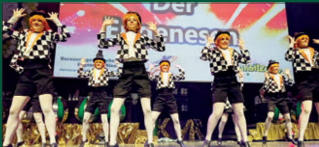
Der Showtanz der Eugenesen sorgte am späten Abend für gute Unterhaltung während der Prunksitzung der KVR.