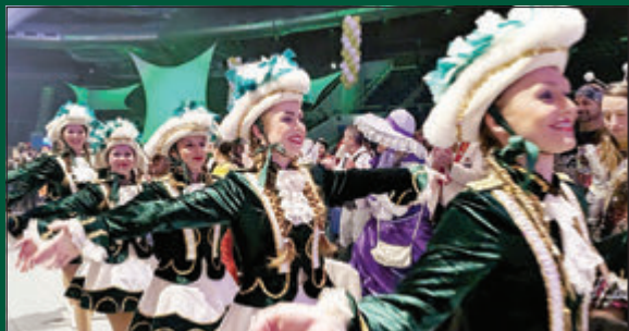
Einzug der Prinzenehrengarde in die Volkswagen Halle in Braunschweig.