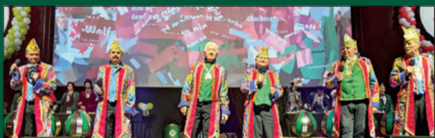
Der Braunschweiger Komiteechor „Die Löwensöhne“ durften bei der Prunksitzung der Karneval-Vereinigung der Rheinländer nicht fehlen.