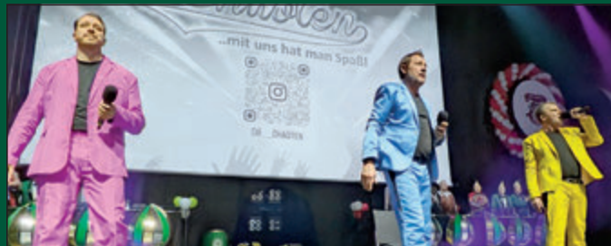
Der Auftritt der „Chaoten“ unterhielt mit viel Spaß die Karnevalisten am Abend vor dem Schoduveel.