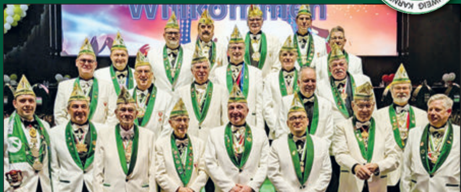
Die Ehrenfunken unterstützen traditionell den Braunschweiger Karneval besonders leidenschaftlich.

vals. Bereits die Eröffnung setzte ein beeindruckendes Zeichen: Mehr als 60 Tänzer:innen der KTG Braunschweig gestalteten den Auftakt und sorgten für einen spektakulären Start in den Abend. Darüber hinaus präsentierten verschiedene Mariechen, die Prinzenhgarde sowie die Funkengarde klassische karnevalistische Tänze. Zwei besondere Showtänze der Eugenesen und des Tanzstudios am Zuckerberg, sowie ein Auftritt von Rope Skipping-Gruppe rundeten das Programm mit kreativen Choreografien ab.